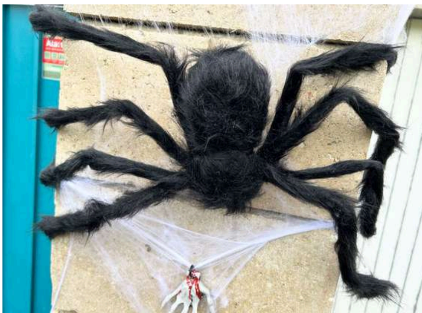
Maisons du village décorées pour Halloween