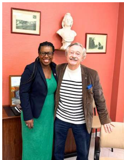
Visite de la députée des Yvelines, Dieynaba DIOP, le 28 octobre 2024