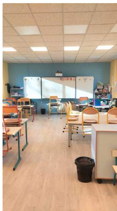
Classe de CE2-CM1-CM2