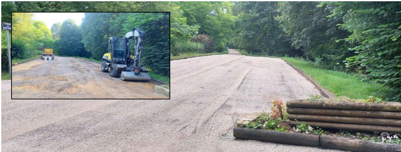
Réfection du chemin des confidences en juillet par l'entreprise T.P.N.