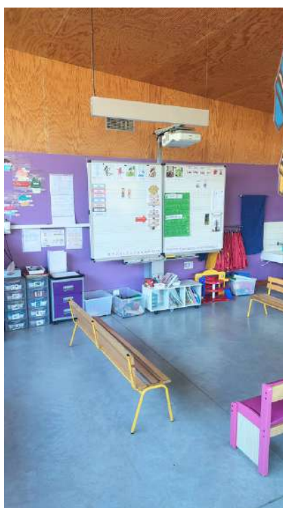
Classe de MS et GS