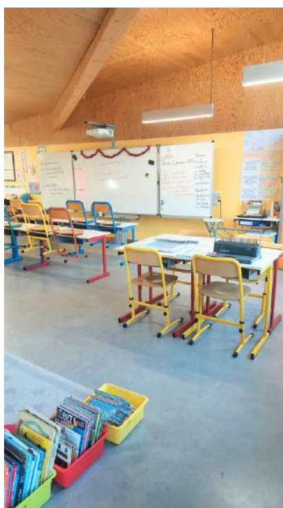
Classe de CP-CE1-CM2

Formulaires et informations disponibles sur le site internet de la mairie http://www.auffreville-brasseuil.fr/inscription-ecole-maternelle/