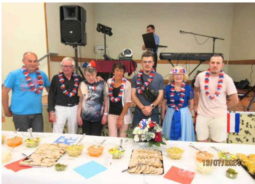
Organisation du repas du 13 juillet par le CIADEC