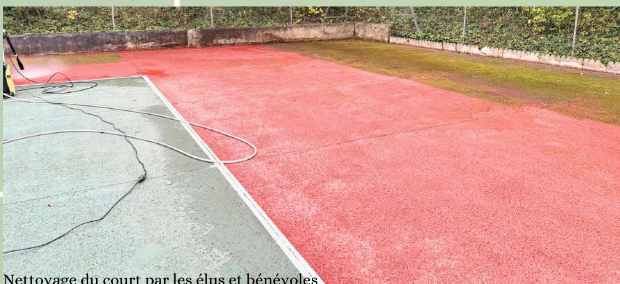
Nettoyage du court par les élus et bénévoles