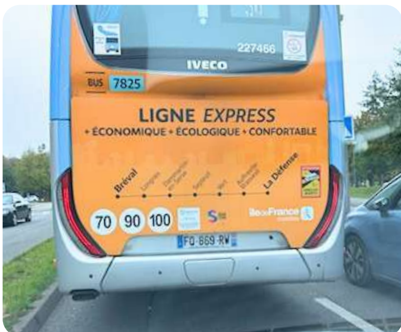
Inauguration le 2 septembre de la ligne express reliant Bréval à la Défense empruntant Auffreville-Brasseuil