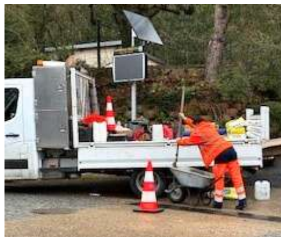
Pose d'un panneau électronique d'informations municipales devant la mairie, rue du Village

Le panneau d'affichage électronique des informations municipales est aussi disponible aux associations auffrevilloises