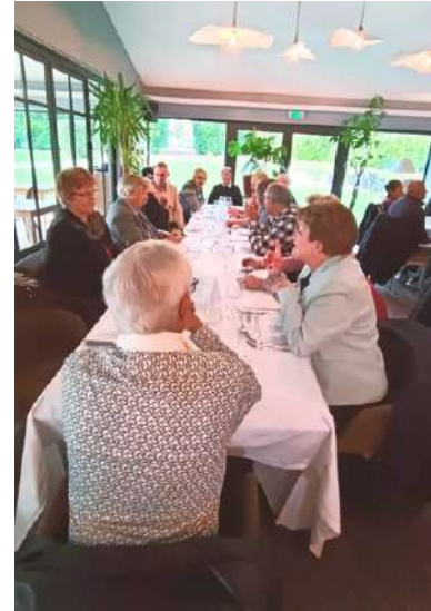
Repas des aînés au Moulin de Fourges