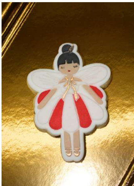
Repas et goûter de Noël de l'école...