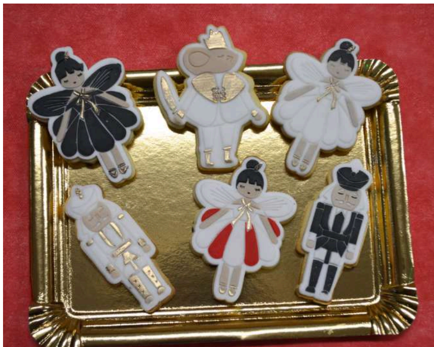
Au menu des festivités, distribution de cadeaux par le père Noël et gâteaux figuratifs réalisés par une maman d'élève, Madame Khebchi dont le talent est remarquable