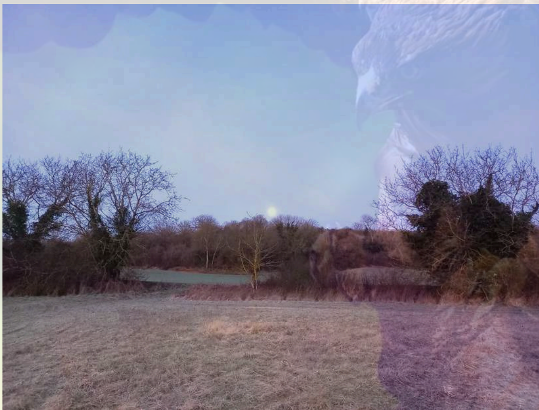
Vue d'Auffreville le 28/01/2024